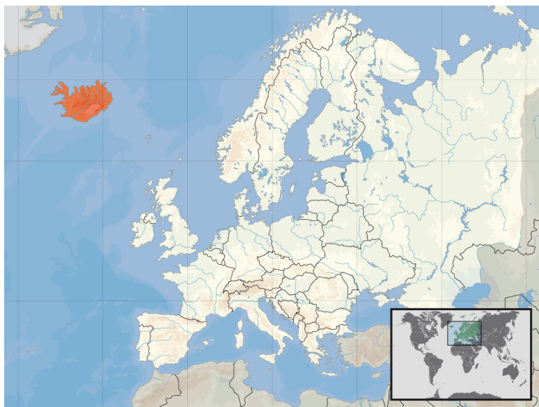
Mapa de la situación de Islandia respecto a Europa.

Resulta de todo punto necesario hacer una brevísima introducción, aun cuando la misma deba ser obligadamente somera y superficial, sobre la historia política, administrativa, económica y social de Islandia hasta finales del siglo xx. Una historia que quizás permita aprehender de forma más fide-