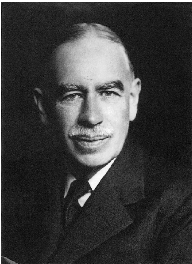
3. John Maynard Keynes (1883-1946).

1. ¿Qué hay de «nuevo» en el liberalismo?