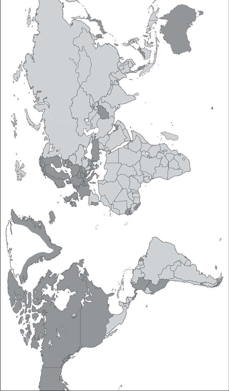
6. « Planeta Kosovo ». La cuestión del reconocimiento internacional de la autoproclamada independencia de Kosovo (mapa a enero de 2009) situó a la diminuta república balcánica en el centro del tablero internacional. El fenómeno sirve para ilustrar hasta qué punto las crisis balcánicas de finales del siglo xx fueron instrumentalizadas por las grandes potencias hasta desmesurar a escala planetaria su sentido inicial, muy circunscrito a intereses regionales concretos.